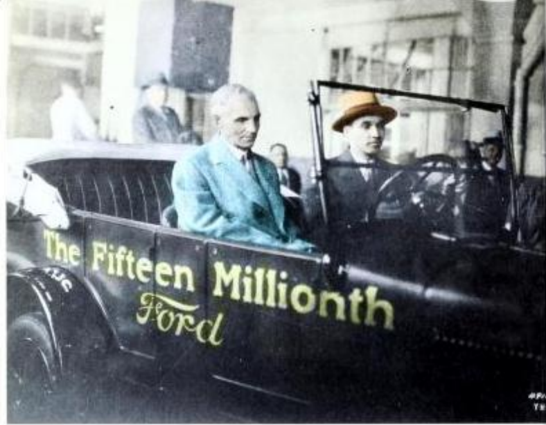
हेन्री फोर्ड (डावीकडे) अंतिम मॉडल-टी मध्ये प्रवास करतांना.