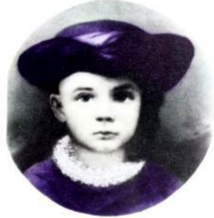
हेन्री फोर्ड लहान मुलाच्या रुपात.