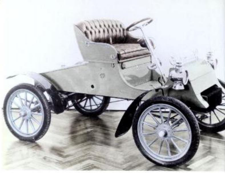
१९०३मध्ये बनी मॉडल-A कार.