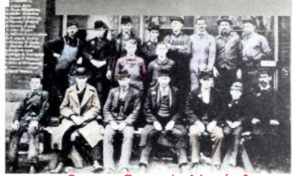
एडिसन इल्लुमिनाशन कंपनीचे कर्मचारी.

हेन्नी १८८२ मध्ये एक प्रमाणित मशीन-मिस्त्री झाला. वेस्टिंगहाउस कंपनीने त्याला मिशिगन च्या आसपास स्टीम इंजिन लावण्यासाठी आणि त्यांची देखभाल करण्यासाठी ठेवलं. हेन्नी नेहमी वजनाने हलके आणि अधिक शक्तिशाली इंजिन निर्माण करण्याच्या उपायाच्याबाबत विचार करत असे.